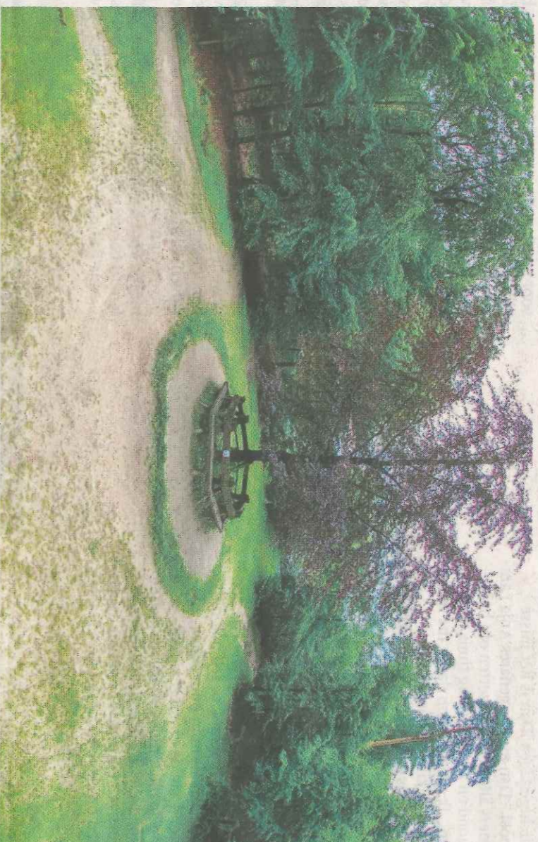
▲ Het sterrenbos heeft in totaal veertien lanen.