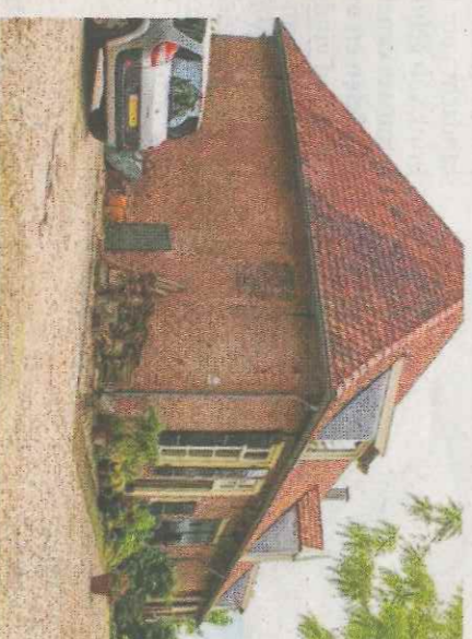
▲ De rentmeesterij.