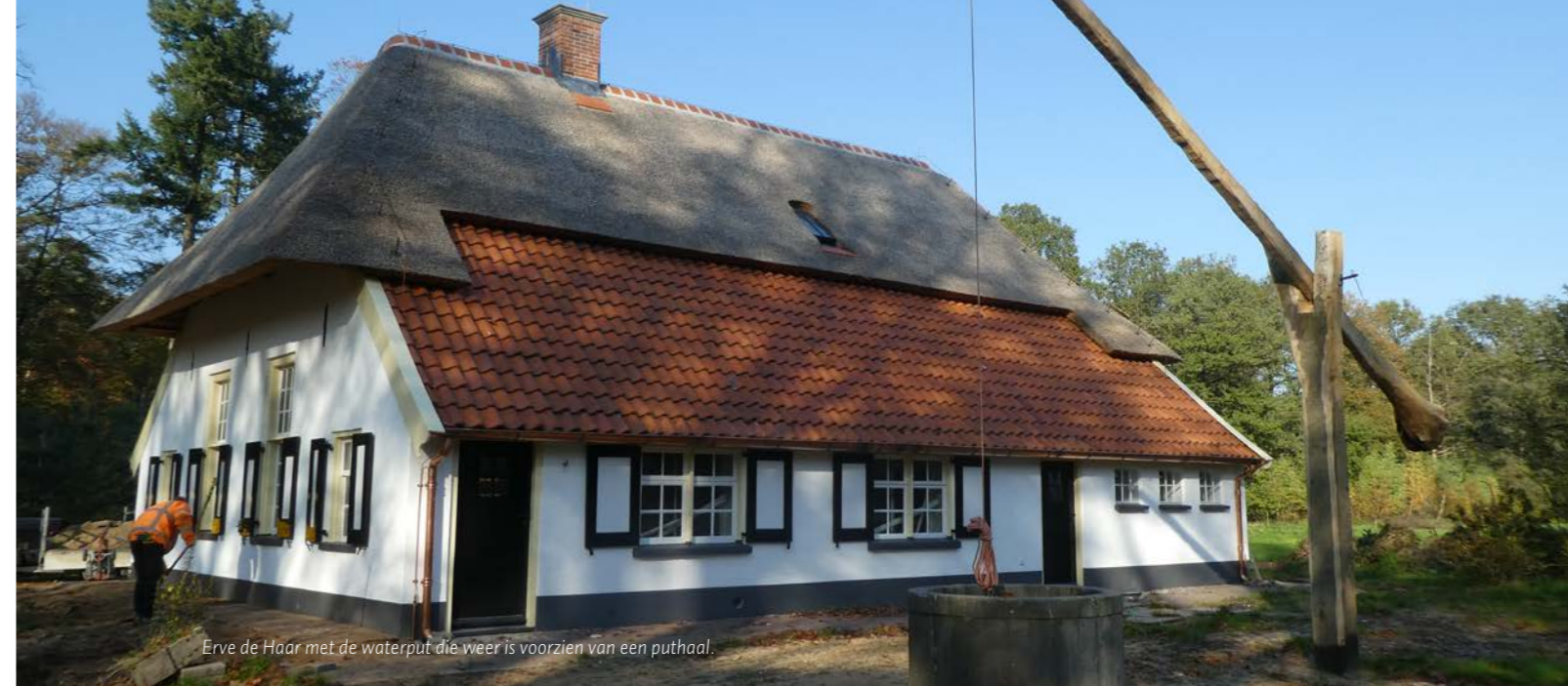
Erve de Haar met de waterput die weer is voorzien van een puthaal.

Ze vormen een twee-eenheid aan de Petzoldweg: erve Arke en erve De Haar. Nadat erve Arke enkele jaren geleden al was opgeknapt, wordt momenteel erve de Haar gerestaureerd. Naast het behoud en herstel van de monumentale waarde is ook hier duurzaamheid leidend.