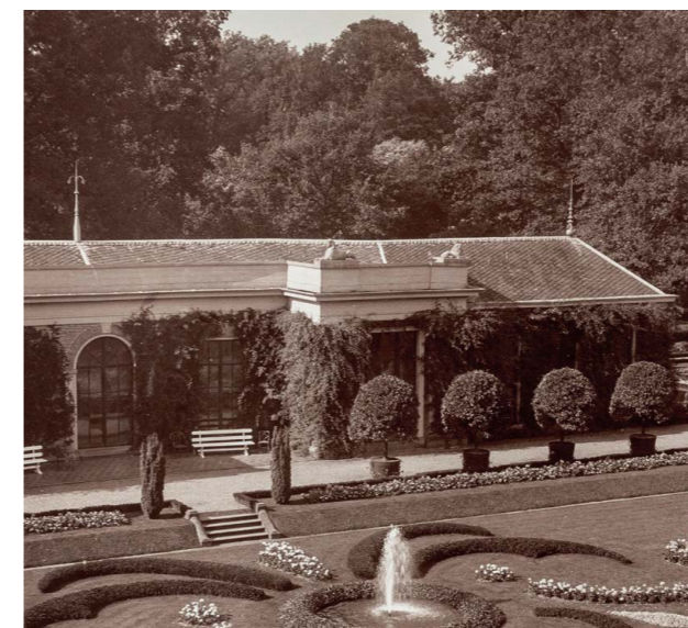
De oranjerie in 1906. Op de attiek boven de dakrand liggen sfinxen en leeuwen.