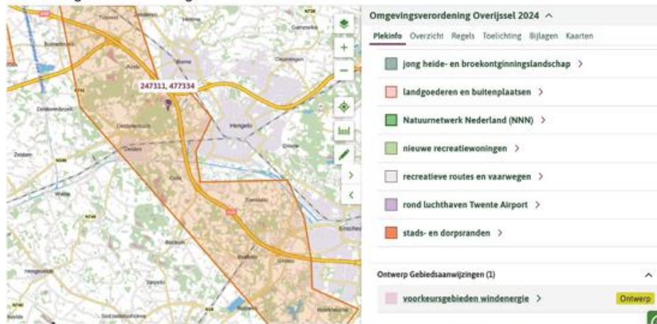
Figuur 1 Een van de voorkeursgebieden windenergie.