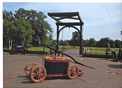
Jan van der Heyden-brandspuit.

In de 20e-eeuw werd opnieuw gemoderniseerd door o.a. de aanschaf van een motorspuit. Ook groeide de samenwerking met de steeds professionelere gemeentelijke brandweer. Tot op de dag van vandaag zijn medewerkers van Twickel actief als vrijwilliger bij het lokale brandweerkorps. Met regelmaat oefenen zij in het kasteel en elders op het landgoed. Hoewel het kasteel dus altijd gespaard is gebleven, zijn op het landgoed vele kleinere en grotere branden geweest, zowel in de natuur als op de erven. Voorbeelden zijn de branden op erve Witveld bij Beckum (2022), erve Argelo (2002) en de heidebrand bij het Kerkveldervoetpad (2016).